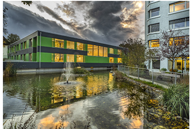
Neubau «Haus am Teich» Lindenfeld © Hertig Noetzi | Architekten