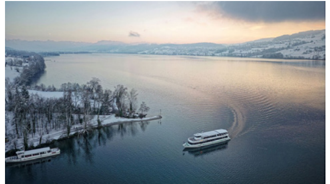
Winterlandschaft in Meisterschwanden mit Blick auf den Hallwilersee