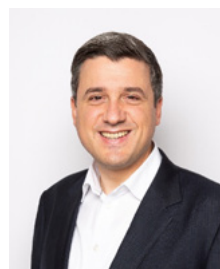
Mathias Zopfi, Ständerat Präsident Schweizerischer Gemeindeverband

Dass unser Verband und ich persönlich für Sie und Ihre Anliegen sprechen dürfen, ist mir eine Ehre und es macht auch Freude. Aber wir brauchen Ihre Rückmeldungen und den Austausch mit unseren Mitgliedern. Deshalb fordere ich Sie auf, nicht nur weiterhin in Ihrer Gemeinde Ihre Arbeit zu machen, sondern von Zeit zu Zeit auch «nach oben zu rufen». Damit wir Artikel 50 BV nicht nur feiern, sondern ihn auch leben.